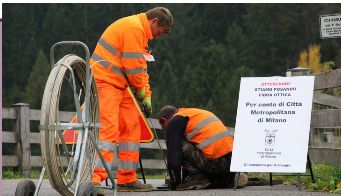
Cantiere fibra ottica

di rafforzare gli interventi di manutenzione delle infrastrutture essenziali del territorio , tra cui la rete viaria provinciale, le piste ciclabili, gli istituti scolastici e gli immobili istituzionali, con stanziamenti previsti per il 2026 pari a 32,8 milioni di euro.