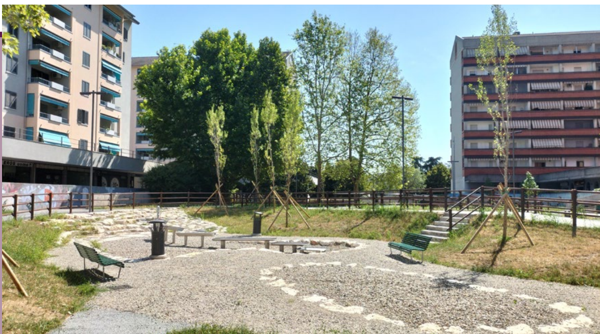
Nuova piazza Spugna ad Opera

«Il coordinamento con i Comuni consente di affrontare in modo più efficace sfide che superano i confini