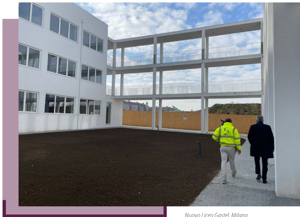
Nuovo Liceo Gastel, Milano

Molti interventi sono ormai in fase avanzata di realizzazione, ma resta centrale il tema della continuità degli investimenti , in particolare per l'edilizia scolastica, per la quale il fab-